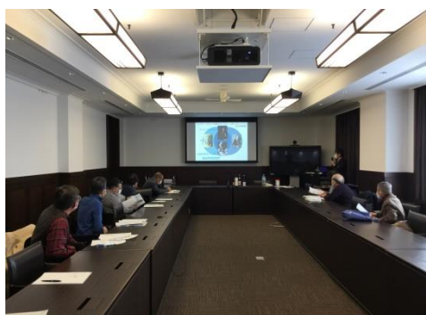
3. 大阪大学会館の会議室