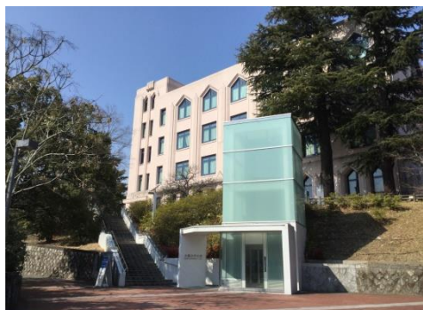
1. 会場の大阪大学会館（旧イ号館）